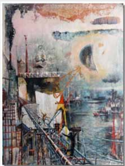
232 Ponti di vista, 60x80cm