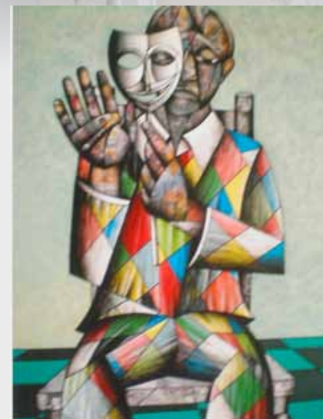
Arlecchino, tecnica mista su tela