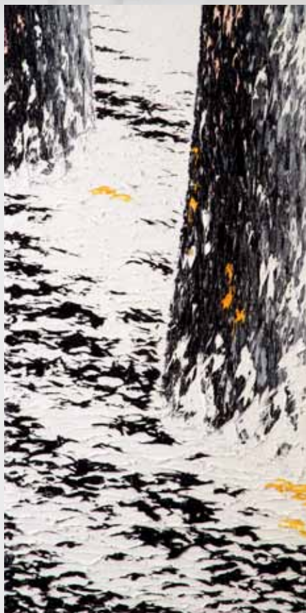
Nevicata in Bianco e nero A 44