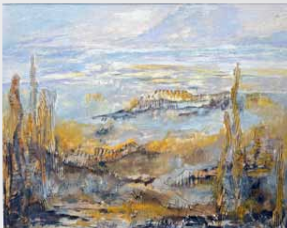
Brughiera, tecnica mista su tela, 40x50 cm